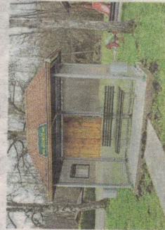
NOVÁ ČEKÁRNA v Jaroměři.

A v Bělé získali tamní obyvatelé zrekonstruovanou klubovnu, kde se mohou se- tkávat, až to bude zase možné. Zde obec při rekonstrukci bývalé prodejny využila do- taci. (zuky)